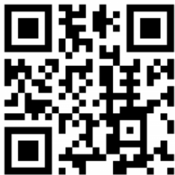
SVEUČILIŠNI ODJEL ZA STRUČNE STUDIJE