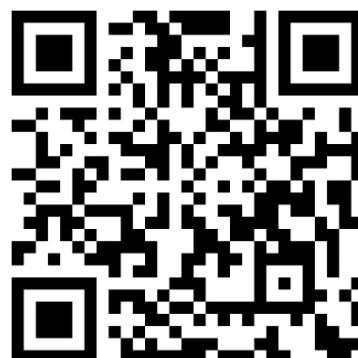
SVEUČILIŠTE U SPLITU